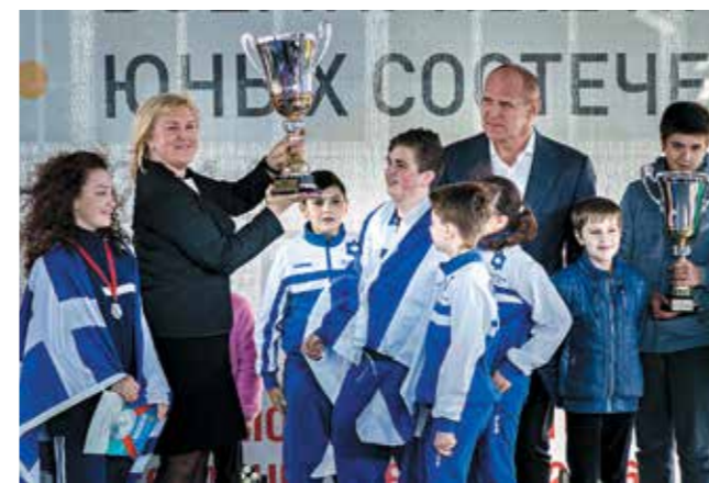
Награждение победителей Вторых Всемирных игр юных соотечественников