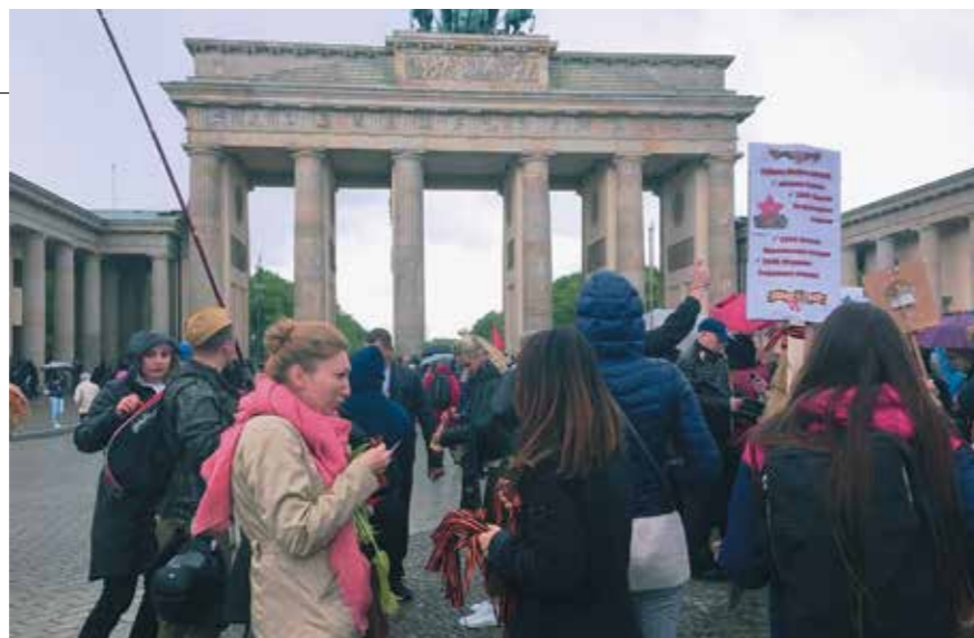
72-ю годовщину Победы отметили в Берлине