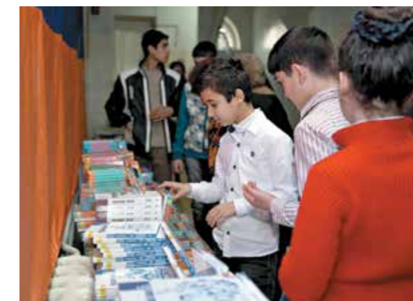
Российский центр науки и культуры в Ереване передал в дар учебники средней школе «Славянская»

Россотрудничество предоставляет нашим соотечественникам и иностранным гражданам, желающим изучать русский язык, возможность доступа к электронным библиотекам на русском языке — это более 120 000 наименований различных книг и периодических изданий.