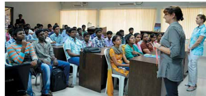
Открытый урок русского языка в РЦНК в Дели