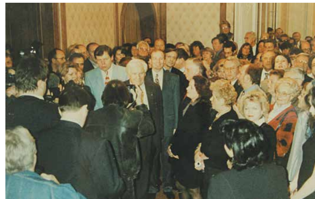
Международная встреча «Мир в XXI веке», Москва, 28-29 сентября 2000 года

В 2002 году был подписан указ «О Российском центре международного, научного и культурного сотрудничества при Министерстве иностранных дел Российской Федерации». Это было сделано в целях усиления координирующей роли МИД России при проведении единой государственной внешнеполитической линии, а также развития экономического, научного и культурного сотрудничества России с другими странами.