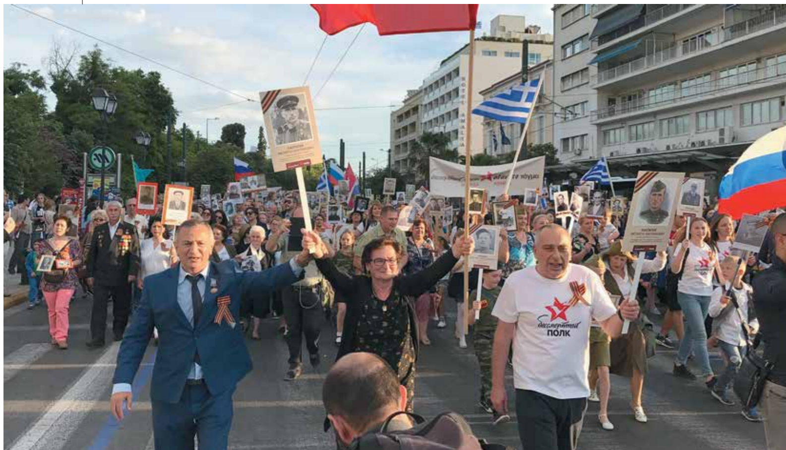
Самый масштабный «Бессмертный полк» в Европе прошел в Афинах