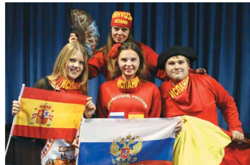
Соотечественники из Испании – одни из участников программы «Здравствуй, Россия!»

Ежегодно в разных странах мира для соотечественников проводятся сотни мероприятий, приуроченных ко Дню народного единства и другим памятным датам российской истории и культуры, творческие фестивали, спортивные турниры, тематические конкурсы, литературно-музыкальные вечера, театральные и кинопоказы.