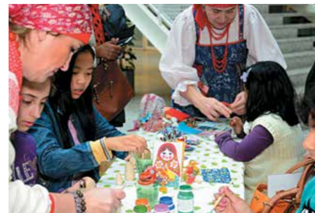
Занятия с детьми в РЦНК в Пекине

Презентация книги «Сергей Рахманинов. Биография» в Российском центре науки и культуры в Праге