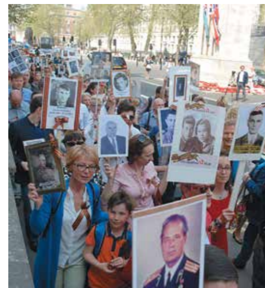
День Победы в Великобритании