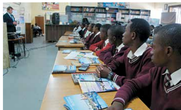
Участники олимпиады «Время учиться в России» из Намибии и Замбии