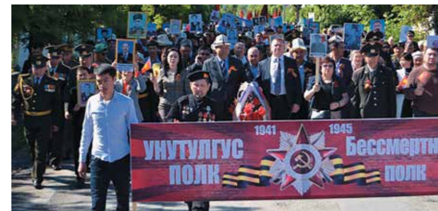
«Бессмертный полк» в киргизском Оше

В 2017 ГОДУ АКЦИЯ ВПЕРВЫЕ ПРОШЛА В ПРЕДСТАВИТЕЛЬСТВАХ РОССОТРУДНИЧЕСТВА В АФГАНИ- СТАНЕ, МАКЕДОНИИ, ЧЕРНОГОРИИ, А ТАКЖЕ НЕДАВНО ОТКРЫТОМ ОТДЕЛЕНИИ РЦНК В ГОМЕЛЕ (БЕ- ЛОРУССИЯ) И РОССИЙСКОМ ЦЕНТРЕ В ОШЕ (КИРГИЗИЯ).