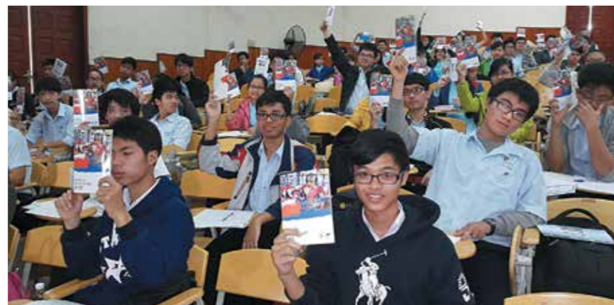
Олимпиада «Время учиться в России» во Вьетнаме

► Согласно Концепции продвижения российского образования, Россотрудничество оказывает содействие экспорту российского образования и продвижению российских вузов в мировом образовательном пространстве. РЦНК являются площадками для проведения выставочных мероприятий, установления контактов между российскими и зарубежными учеными, реализации проектов молодежного сотрудничества. Российские вузы организуют на базе РЦНК выездные «Дни открытых дверей», проводят отборочные кампании по набору иностранных граждан на обучение по своим образовательным программам как по линии государственных стипендий Российской Федерации, так и на контрактной основе.