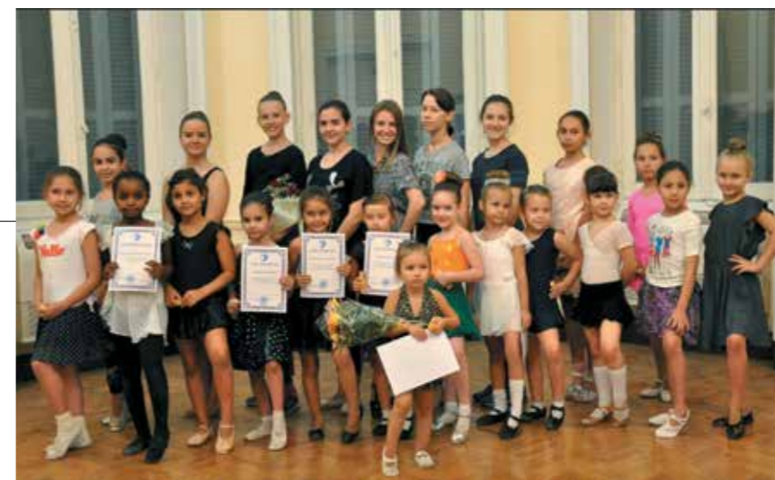
Ученики студии балльных танцев «Российского центра науки и культуры в Каире»