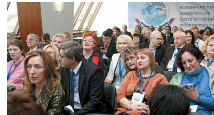
На Всемирной тематической конференции соотечественников, проживающих за рубежом «Вместе с Россией»