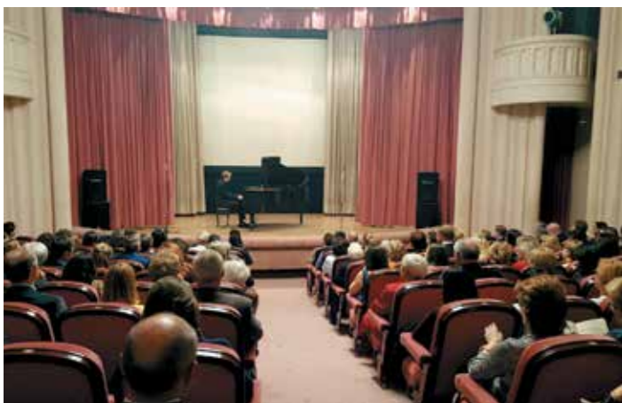
Концерт «Посольства мастерства» в Испании

Еще один популярный проект не только среди наших соотечественники, но и иностранцев – «Посольство мастерства», организуемый совместно с Санкт-Петербургским Домом музыки. За рубежом отмечаются многие российские культурно-исторические даты. Так, например, широко празднуется Международный день авиации и космонавтики: проводятся встречи с российскими космонавтами, фото- и художественные выставки и другие мероприятия. Россотрудничество участвует в организации культурных мероприятий и в рамках со-