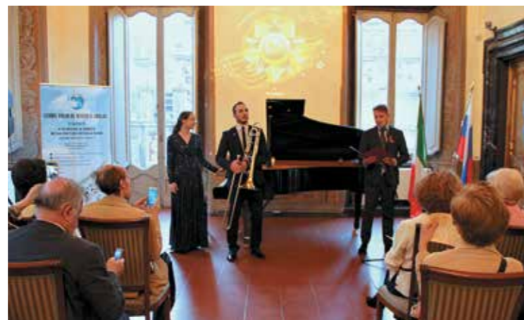
Концерт в Российском центре науки и культуры в Риме

В 2016 г. в РЦНК и на партнерских площадках Россотрудничества в