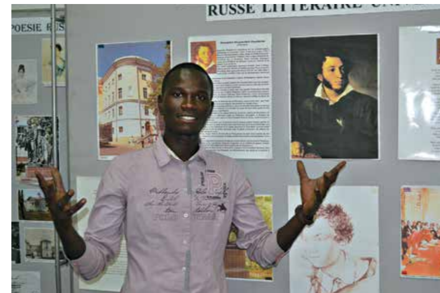
Слушатель курсов русского языка из Конго

Россотрудничество предоставляет нашим соотечественникам и иностранным гражданам, желающим изучать русский язык, возможность доступа к электронным библиотекам на русском языке — это более 120 000 наименований различных книг и периодических изданий.