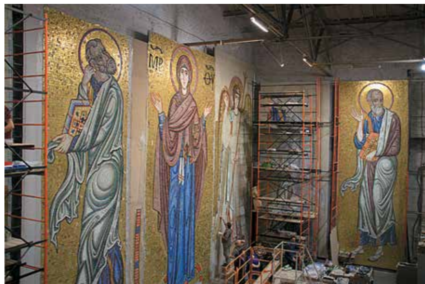
Фрагмент мозаики купола Храма Святого Саввы в Русском Доме в Белграде

Храм Святого Саввы на Врачаре — важнейший памятник архитектуры в Сербии и один из крупнейших православных храмов в мире. Он был построен на месте сожжения мощей Святого Саввы оттоманскими властями в 1594 году. Собор спроектировали в конце XIX века, строить его начали только в 1935 году, однако строительство было отложено из-за начала Второй мировой войны. Возведение купола было завершено в 1989 году, официально храм открыли только в 2004 году. Храм Святого Саввы в Белграде является одним из самых больших православных храмов в мире, он сравним по величине с Храмом Христа Спасителя в Москве.