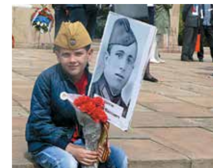
В Сербии празднуют День Победы