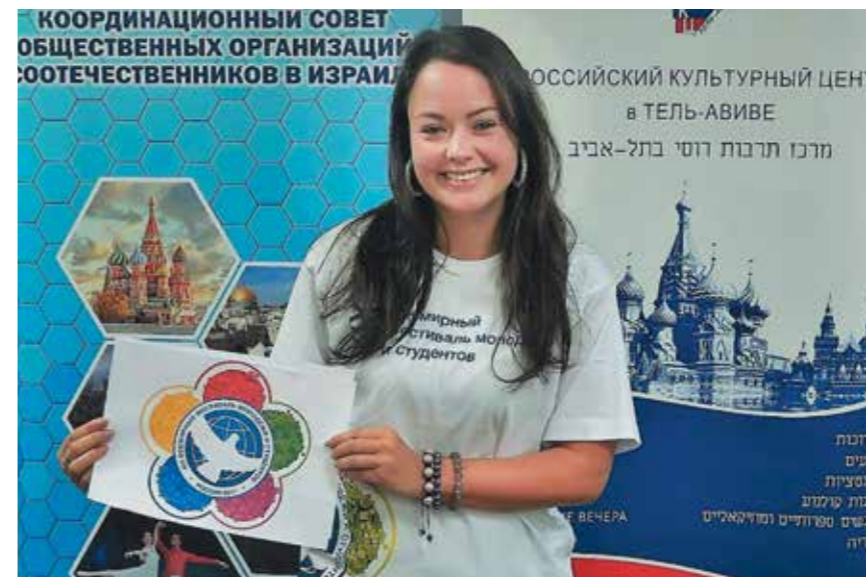
Презентация XIX Всемирного фестиваля молодежи и студентов в Российском культурном центре в Тель-Авиве

В настоящее время выполнен макет купола Храма Святого Саввы (в масштабе 1:10), который все желающие могут осмотреть в представительстве Россотрудничества в Сербии — Русском доме в Белграде. Оттуда ведется онлайн-трансляция проводимых в храме работ.