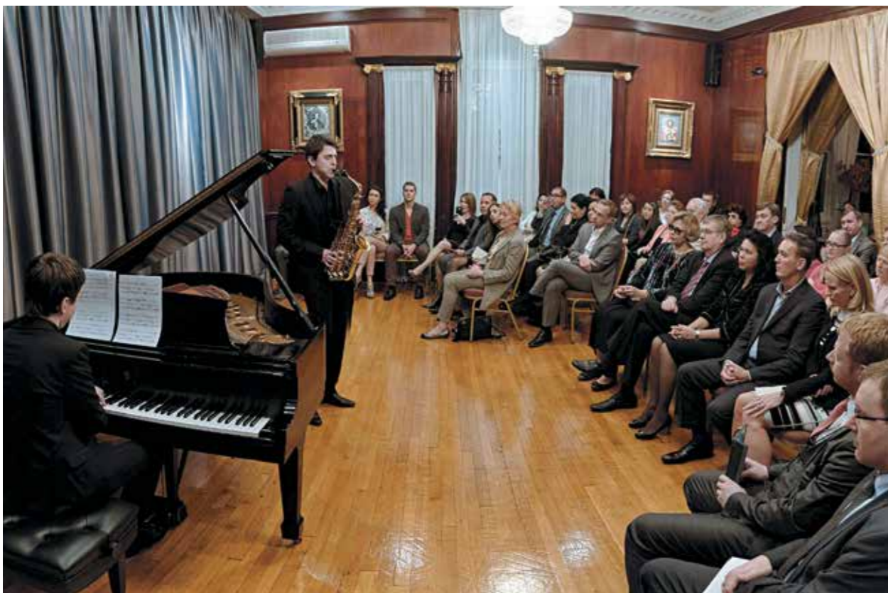
Концерт в честь Дня народного единства в РЦНК в Вашингтоне

Русскоязычная диаспора является одной из самых многочисленных в мире. В настоящее время она насчитывает около 30 млн российских соотечественников, по разным причинам оказавшихся за пределами России. Проживая за рубежом и будучи включенными в другие системы ценностей, наши соотечественники не теряют связи с исторической Родиной. Не только они сами, но и их дети знают и любят русский язык, культуру и традиции. Деятельность Россотрудничества направлена на консолидацию русскоязычной общины и укрепление их связей с исторической Родиной, сохранение отечественного культурного наследия и этнокультурной самобытности, развитие и распространение за рубежом русской культуры и русского языка.